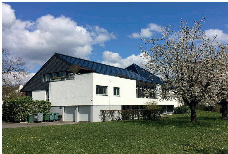
Kirchgemeindehaus mit Kirschaum in Blüte