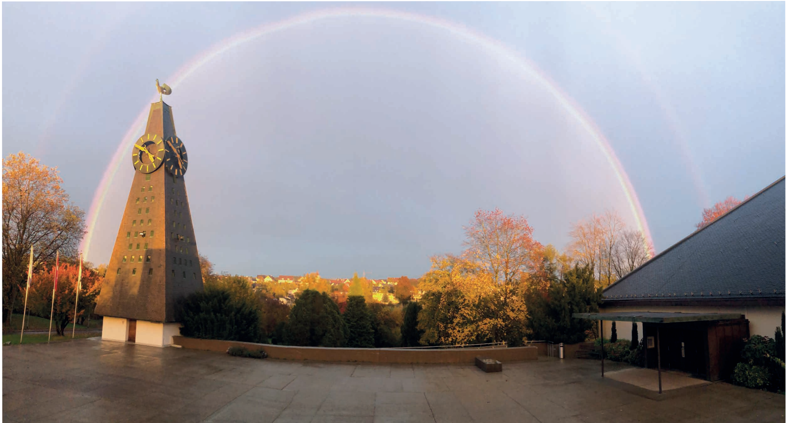
Reformierte Kirche mit Regenbogen