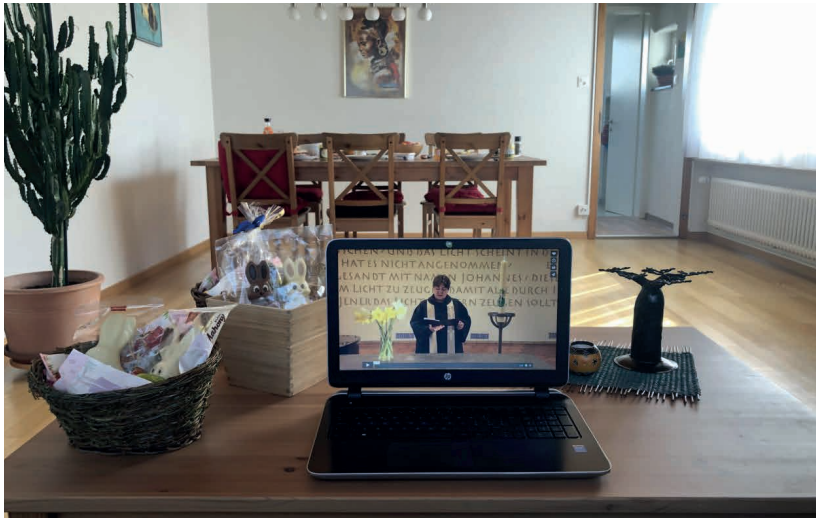
Ostern im Lockdown, Cindy Gehrig