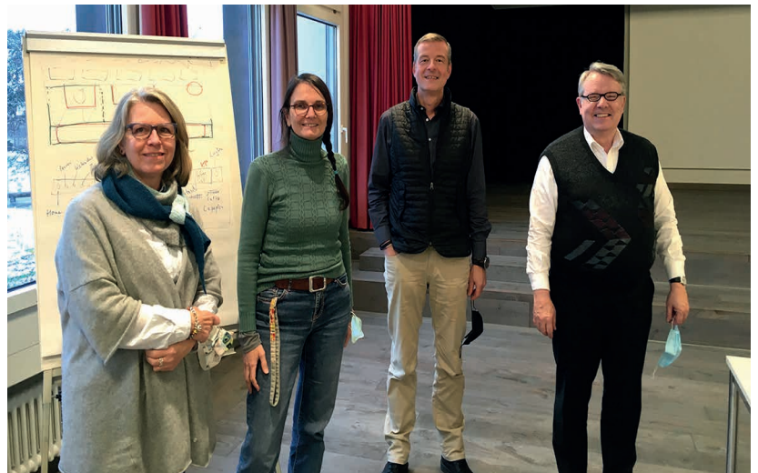
WEB21 – Projektteam