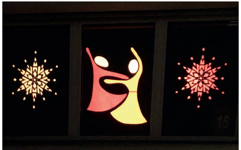
Adventsfenster, hier durfte noch getanzt werden