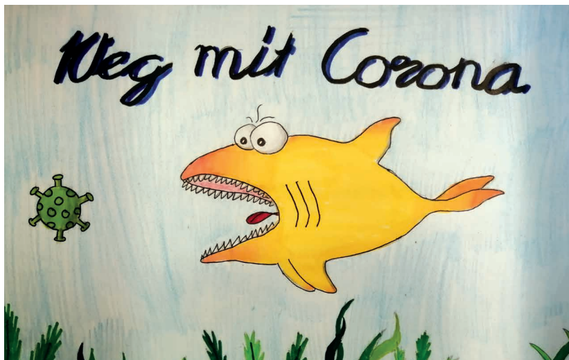
«2021 – Ich will mich freuen»