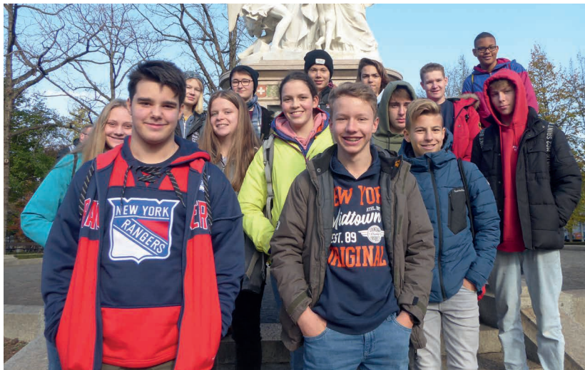
Konfirmandinnen und Konfirmanden in Basel