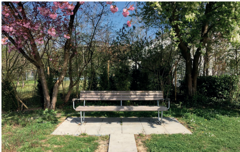
Aussenbüro für Beratungsgespräche in Coronazeiten