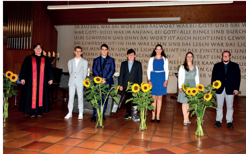
Konfirmandinnen und Konfirmanden 2020