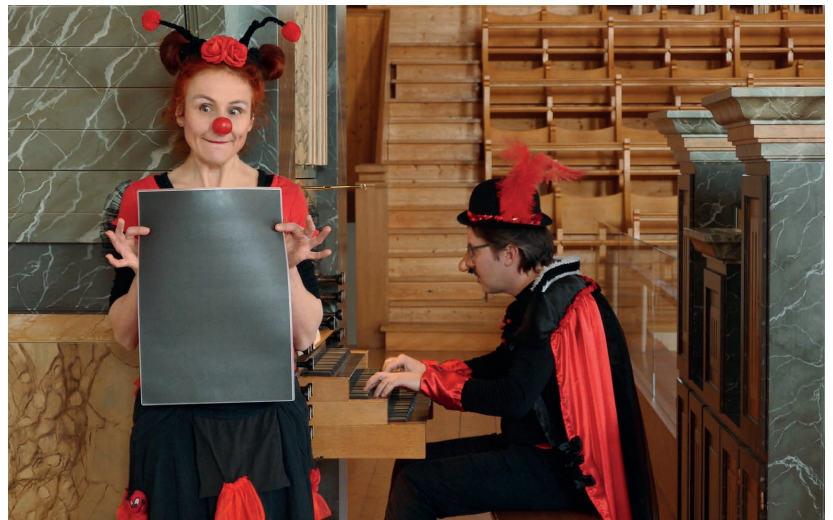
Ein clowneskes Orgelkonzert für Kinder: «Coccinella und Cocello»