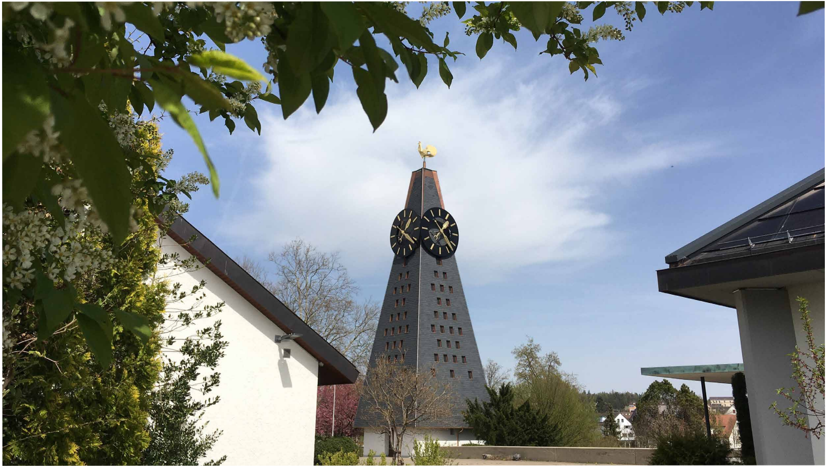
Reformierte Kirche Opfikon