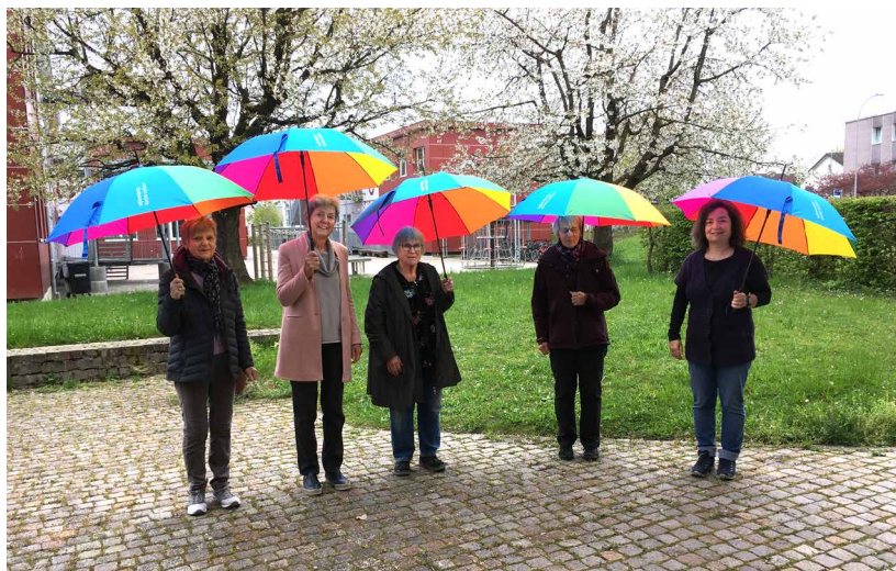
Freiwilligenteam - Geburtstagsgruppe